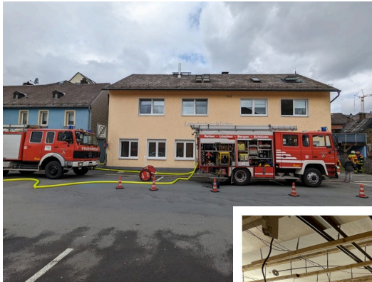
Brand in der LKG Naila